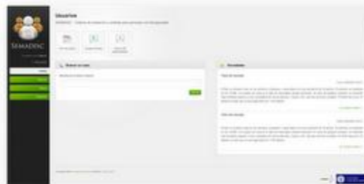
Ilustración 3: Menú principal.

La plataforma ha sido desarrollada por un grupo de Ingenieros en Informática cuidando los detalles técnicos y asegurando el correcto cumplimiento de los requisitos legales que rodean el sistema. Se ha tenido especial cuidado con la privacidad de los usuarios , la seguridad y la adaptación a la legislación en el ámbito de la protección de datos , adaptando todo el proceso a la Ley 15/1999 , de protección de datos de carácter personal.