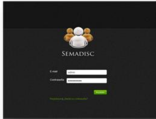
Ilustración 2: Pantalla de acceso al sistema.

La plataforma ha sido desarrollada por un grupo de Ingenieros en Informática cuidando los detalles técnicos y asegurando el correcto cumplimiento de los requisitos legales que rodean el sistema. Se ha tenido especial cuidado con la privacidad de los usuarios , la seguridad y la adaptación a la legislación en el ámbito de la protección de datos , adaptando todo el proceso a la Ley 15/1999 , de protección de datos de carácter personal.